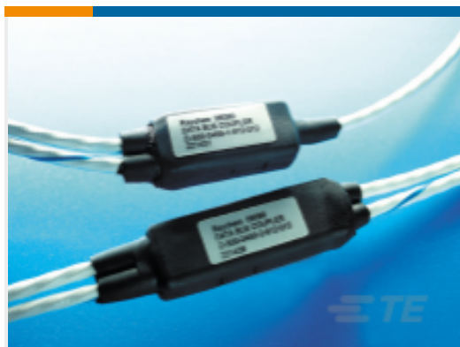
TE 产品编号455188-000 D-500-0255-021-02