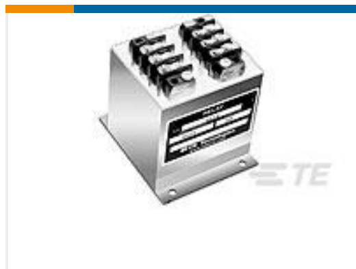
TE 产品编号1618096-3 910-3X=WILMAR PHASE SEQUENCE