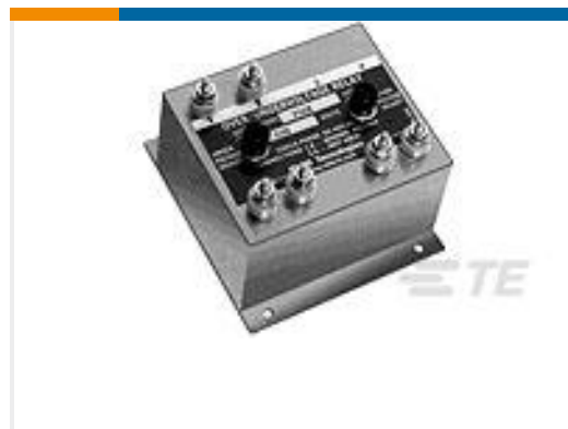
TE 产品编号5-1618071-6 253-5X=WILMAR OVER /UNDervOLTAG