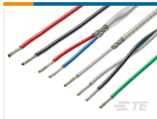
TE 产品编号306409-000 44AM1141-20-0/2/5/9-9