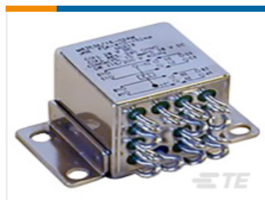
TE 产品编号4-1617813-6 TD228-7500P=TDFO .75 SEC M83726 /28-7500P