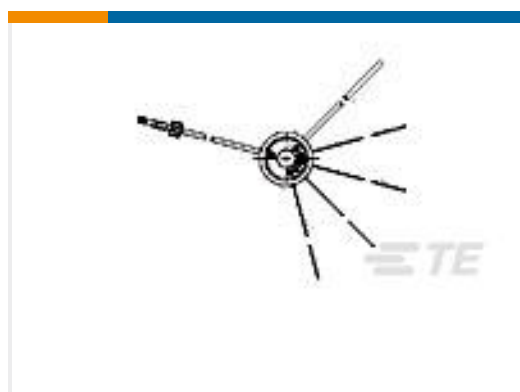
TE 产品编号867121-1 12 POS TUBE BASE & FLY LEADS