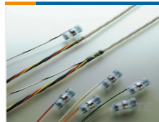
TE 产品编号632496N001 S02-20-R-5CS1093