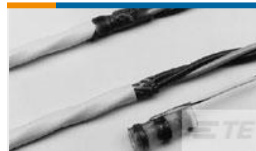
TE 产品编号 227540N002 S02-10-R-4CS816