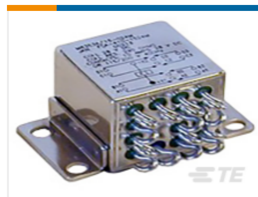
TE 产品编号 2-1617813-4 TD228-4001S=TDFO 3 SEC M83726 /28-4001S