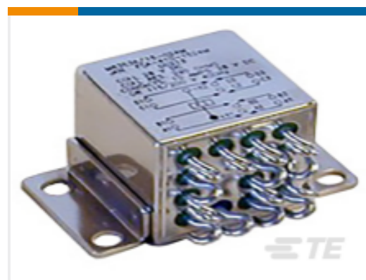
TE 产品编号 4-1617808-5 TD229-1803P=TDFO 180 SEC M83726 /29-1803P