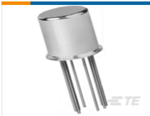
TE 产品编号 1617169-2 JMSWDD-18XP = M39016/21-011P