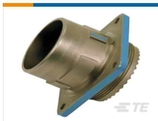
TE 产品编号 YDIV46E21-11PAC009 PLUG ASSY