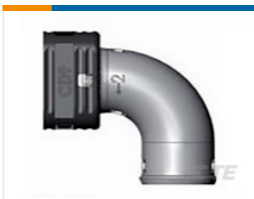
TE 产品编号ZPF000000000102764 787-8055-30M