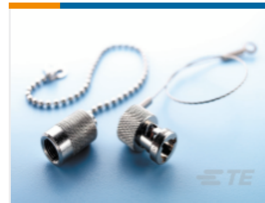
TE 产品编号233591-000 D-600-0068-3