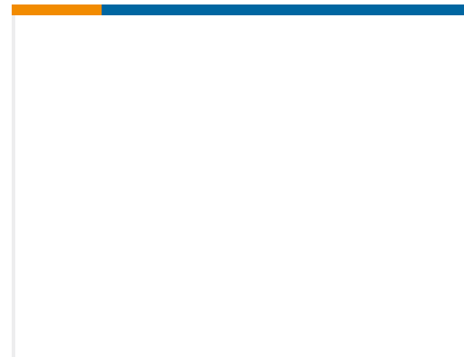
TE 产品编号623161N002 D-148-0206CS964