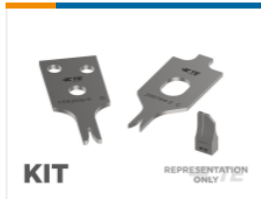
TE 产品编号7-2836422-7 OCEAN_2.0_SPARE_PART_KIT-062F0700