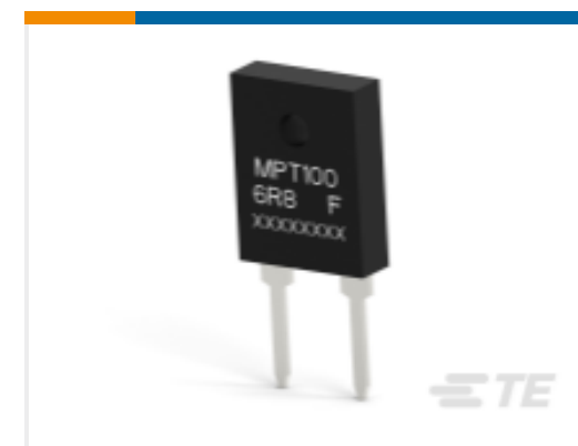
TE 产品编号 2176429-5 MPT100 R47 5%