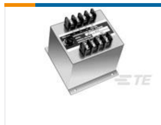
TE 产品编号 2-1618108-3 WOV-3-440=WILMAR OVERVOLTAGE 4