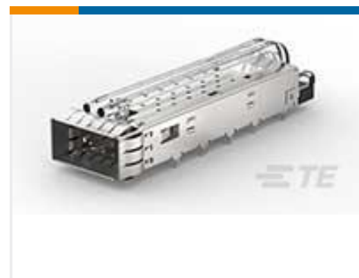
TE 产品编号 2170773-1 CAGE ASSY, QSFP28 1X1, SPRING, LP