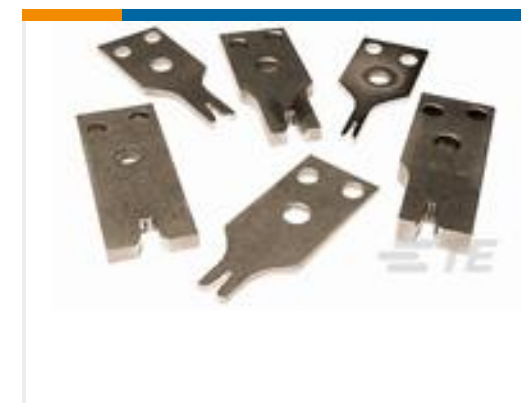
TE 产品编号 2-456406-5 WIRE CRIMPER .090