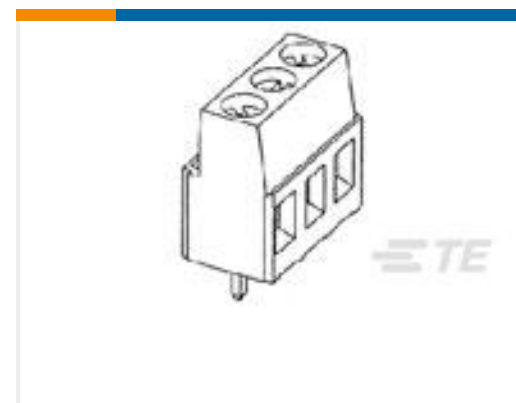
TE 产品编号 1-282841-1 TERMI-BLOK PCB MOUNT 11P.5