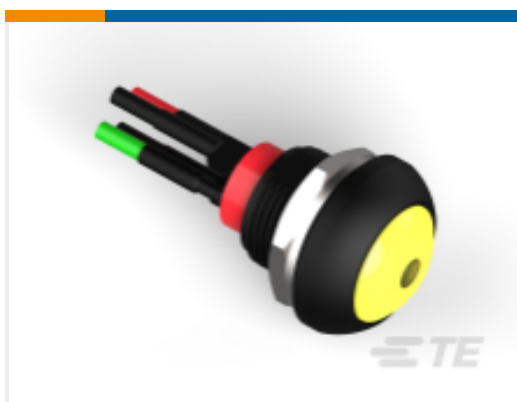
TE 产品编号 1-2329389-1 PB OFF/ON FC YLW M1 TERM WHI LED IP68 50