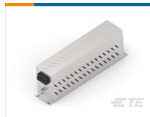
TE 产品编号 2-1609998-3 KEV 42A 2S SP WYE BS 440VAC