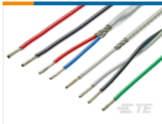
TE 产品编号265805-000 81044/9-4-6