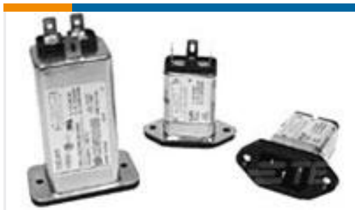
TE 产品编号6609008-6 1EJH2=F8036 S0