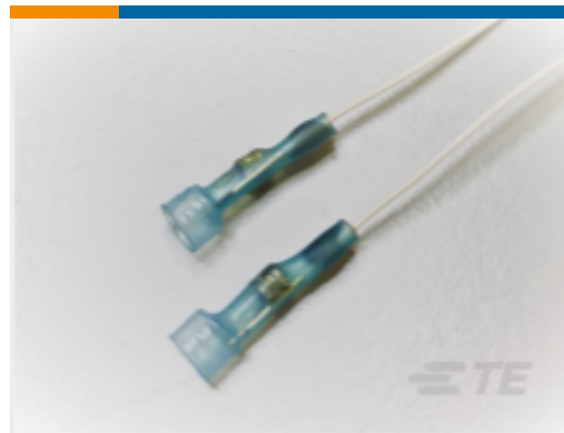
TE 产品编号375105-000 D-112-3622