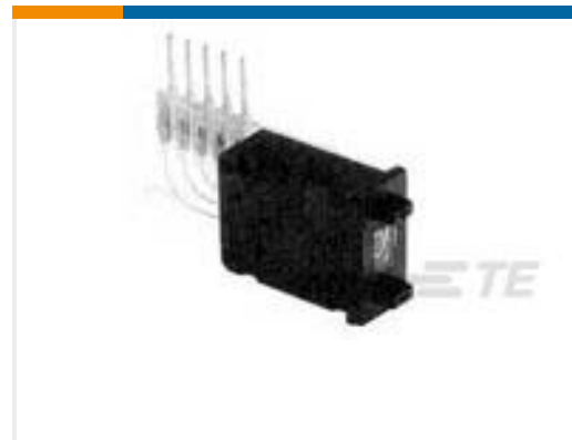
TE 产品编号1-1437601-9 PICOD301AK=PICO-D-301-AK-2