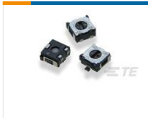
TE 产品编号1623909-7 3204 20K