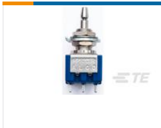
TE 产品编号1977739-2 MPS103F PSHBTTN SPDT MMNTRY