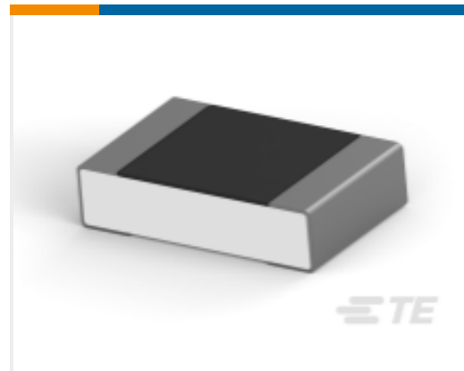
TE 产品编号1-2176382-6 RQ 0805 191K 0.1% 10PPM 5K RL