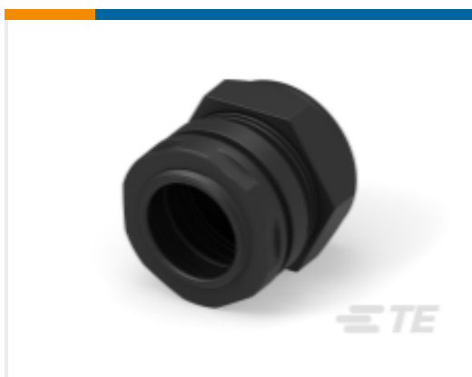
TE 产品编号1478769-5 ANTI-VIB NYLON GLD 25MM BLK