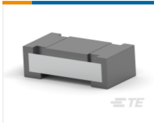
TE 产品编号1-2176051-2 厚膜电阻器：电流感应