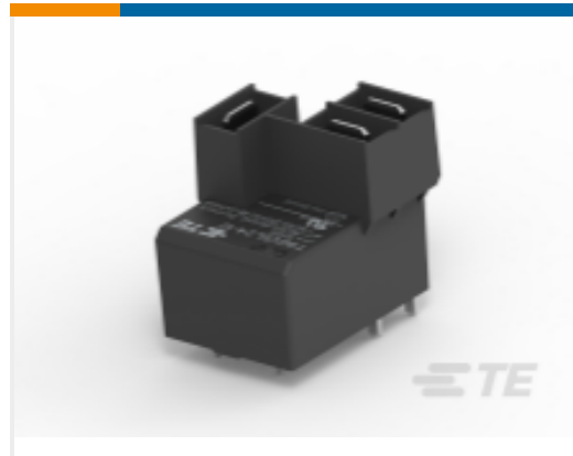
TE 产品编号1558671-5 T9GV1L24-18