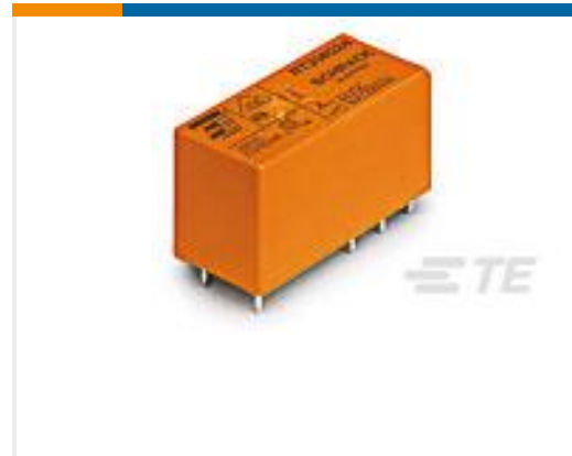
TE 产品编号1393240-4 RT314524