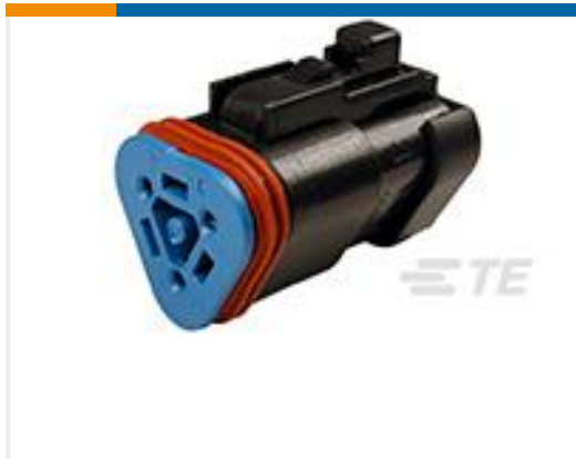
TE 产品编号DT06-3S-EP10 PLG, 3P, BLK, 120 OHM RESISTOR