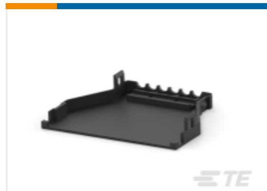
TE 产品编号1776695-1 Strain Relief, D5200, Dynamic