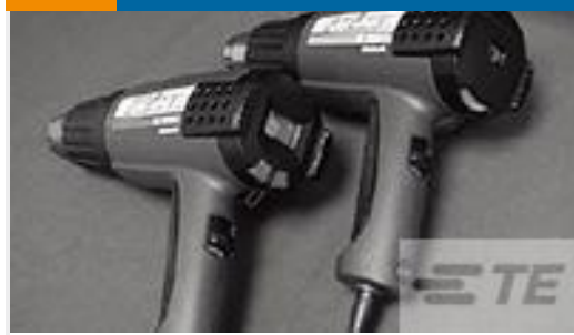
TE 产品编号 CJ2087-000 HL2010E-KIT-120V