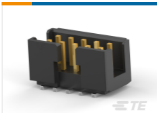
TE 产品编号1-2373376-0 10P,2MM,SHRD HDR,DRVT,SMD,0.1 AU,TB