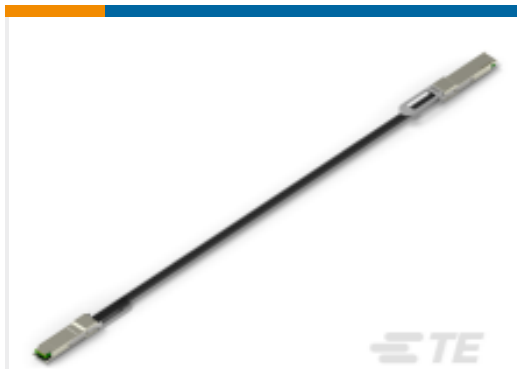
TE 产品编号2333393-3 30 AWG QSFP28 对 QSFP28 电缆组件