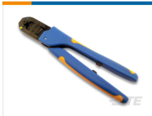
TE 产品编号2217748-1 CCII AMPSEAL CONT 20-16 ASSY