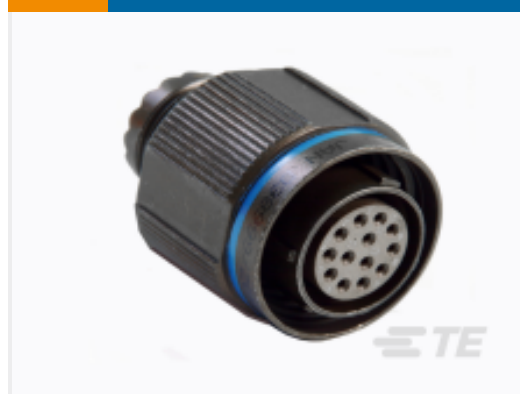
TE 产品编号YDTS26F15-35PAC001 PLUG ASSY