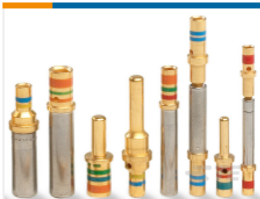
TE 产品编号38941-22L CONTACTS