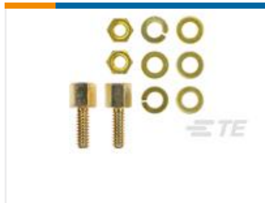
TE 产品编号5205817-1 KIT SCREWLOCK FEMALE