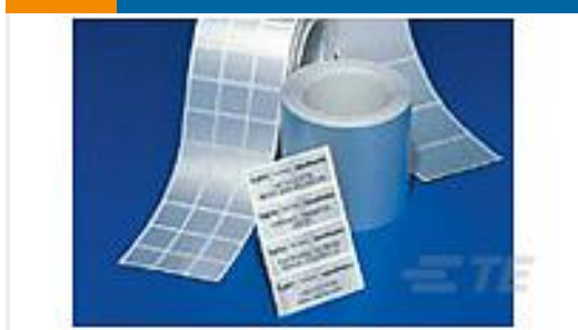
TE 产品编号A83632-000 MP-254064-10-8A