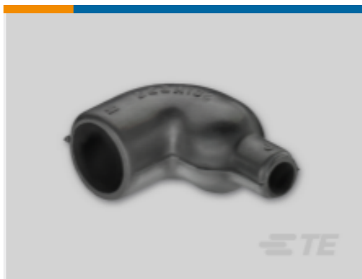
TE 产品编号 806823-000 球形热缩护套：有嘴，直角