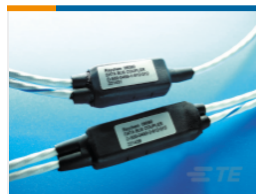
TE 产品编号279316-000 D-500-04-C23-072