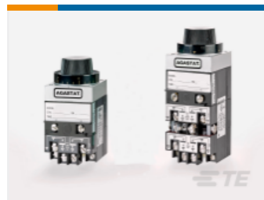
TE 产品编号5-1423162-3 7022AAT=RLY,STD,OFF,2P,120VAC,