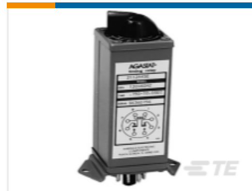
TE 产品编号1-1423153-1 2122AH39DF=RLY,MINI,OFF,2P,24V