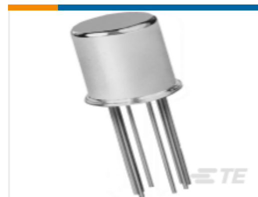
TE 产品编号6-1617540-4 J1MAP-6XL=M39016/7-016L