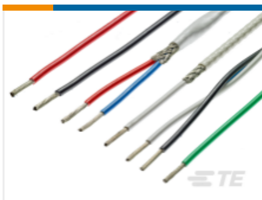
TE 产品编号387778-000 44A1111-22-90-9