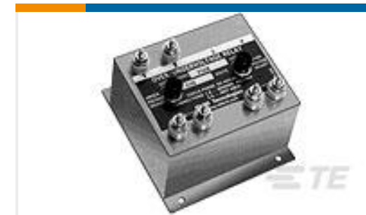
TE 产品编号5-1618071-6 253-5X=WILMAR OVER /UNDERVOLTAG