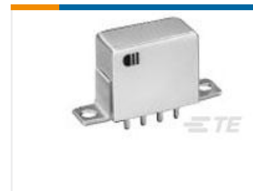
TE 产品编号5-1617002-1 B07B112CC1 = RELAY.