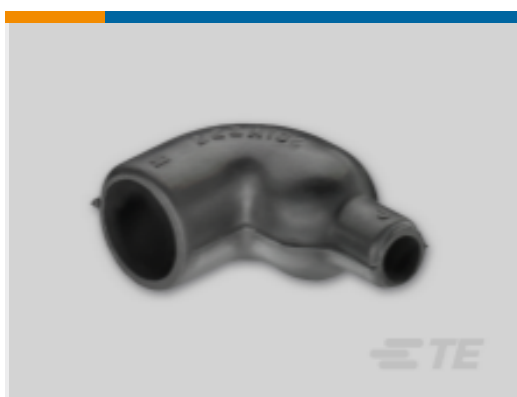
TE 产品编号806823-000 球形热缩护套：有嘴，直角