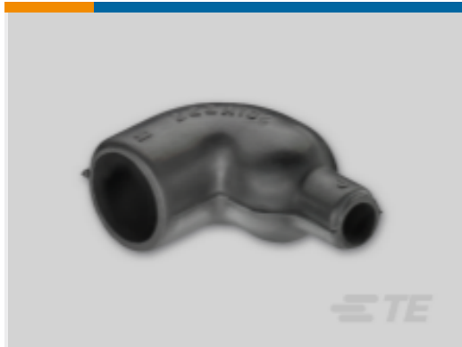
TE 产品编号806823-000 球形热缩护套：有嘴，直角