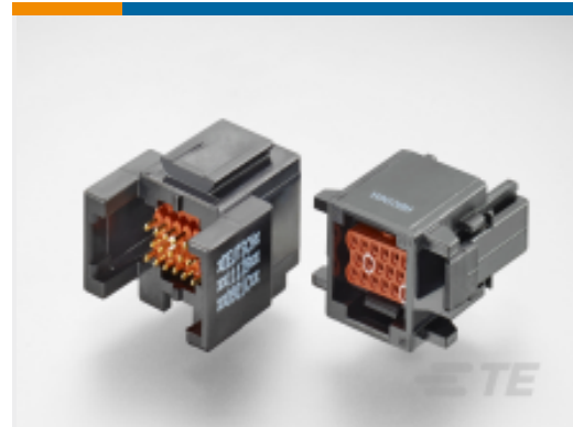
TE 产品编号ABC03N-20P IN-LINE RECIP