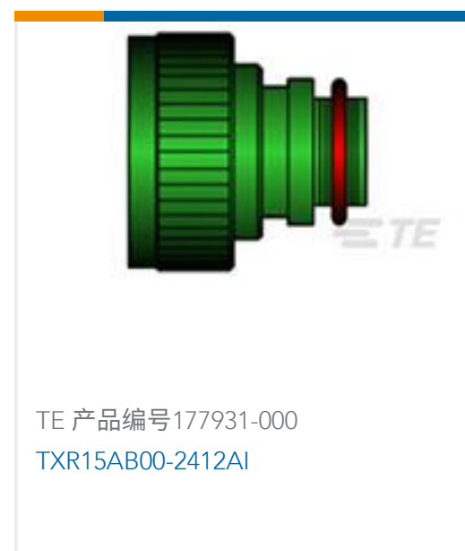
TE 产品编号 177931-000 TXR15AB00-2412AI