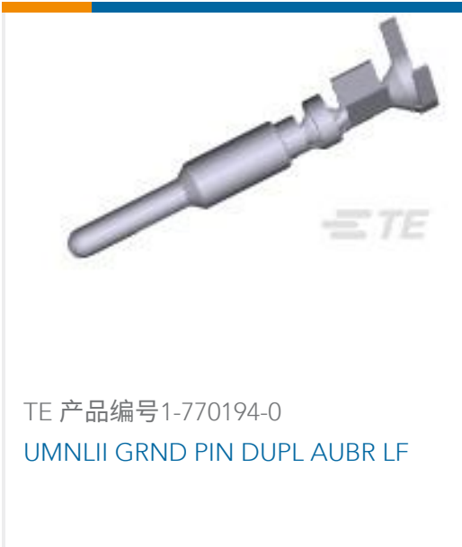
TE 产品编号 1-770194-0 UMNLII GRND PIN DUPL AU BR LF