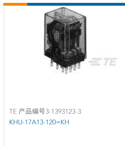
TE 产品编号 3-1393123-3 KHU-17A13-120=KH