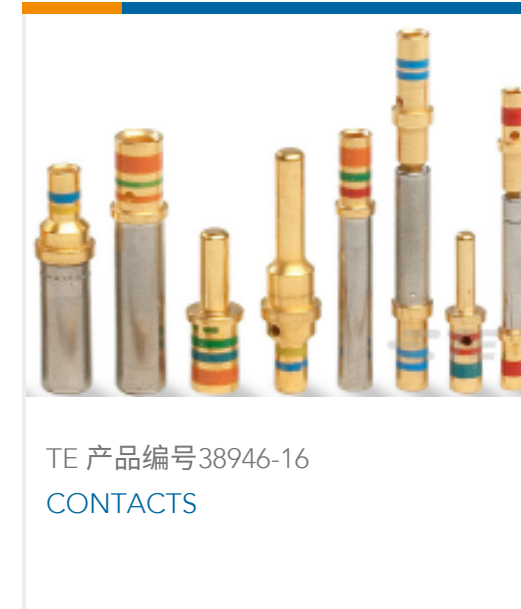
TE 产品编号 38946-16 CONTACTS