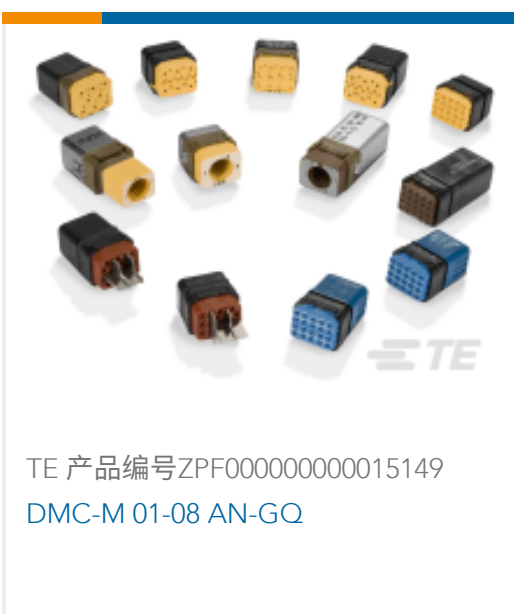
TE 产品编号 ZPF000000000015149 DMC-M 01-08 AN-GQ