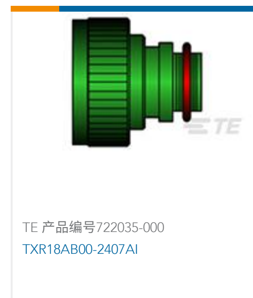
TE 产品编号 722035-000 TXR18AB00-2407AI