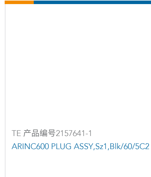
TE 产品编号 2157641-1 ARINC600 PLUG ASSY, Sz1, Blk/60/5C2