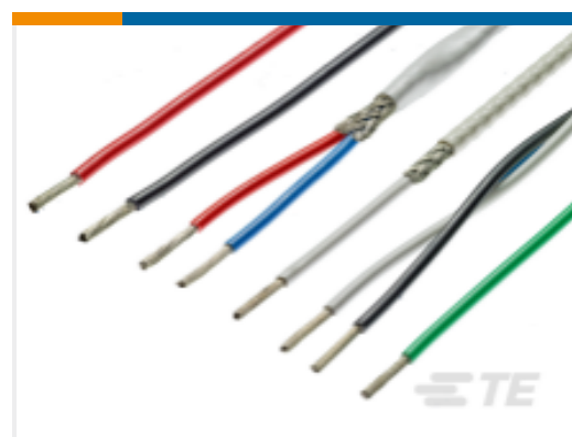
TE 产品编号383132-000 44A1124-24-2/6-9