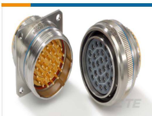
TE 产品编号ZPF00000000007732 983-05E 24-61 SN-L