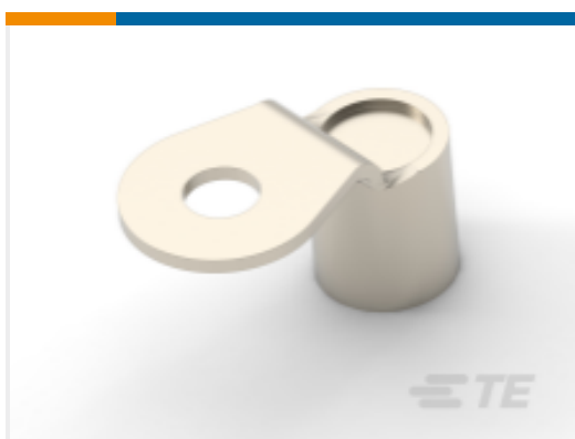
TE 产品编号1958542-1 TERM, STRAT, R, HR, 1/0, 5/16, 90 BEND