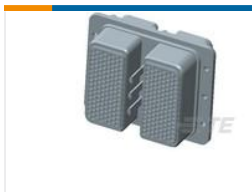
TE 产品编号445595-4 PLG KIT,ARINC 404,W/O CONTACTS