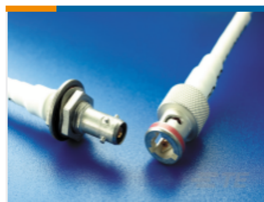
TE 产品编号202473-000 D-621-0438