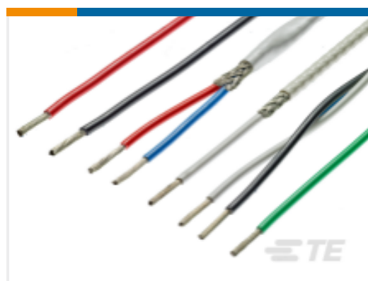
TE 产品编号379165-000 44A1124-24-0/4-9