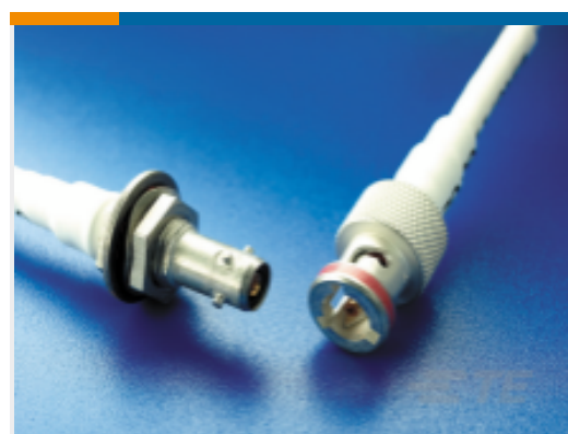
TE 产品编号613049-000 D-621-0436