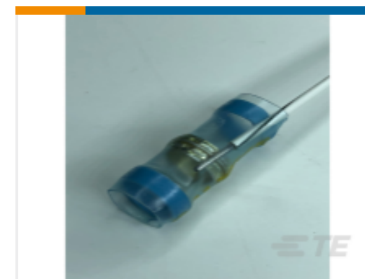
TE 产品编号 EH1577-000 SO63-1-01CS4036