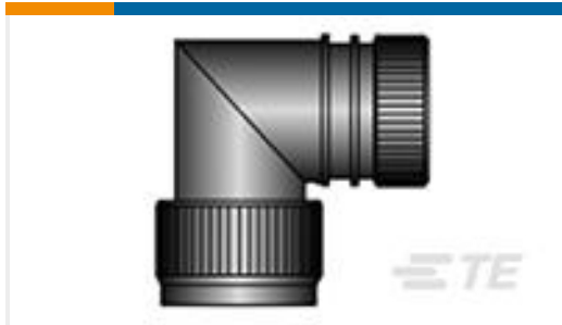
TE 产品编号 CP1571-000 HEX40-AB-90S-09-A1-1