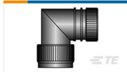
TE 产品编号 357176-000 HEX40-AC-90S-11-A2-1