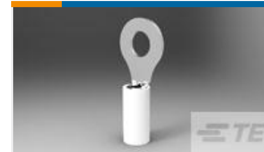
TE 产品编号 50841 TERMINAL,PIDG PTFE R 14 1/4