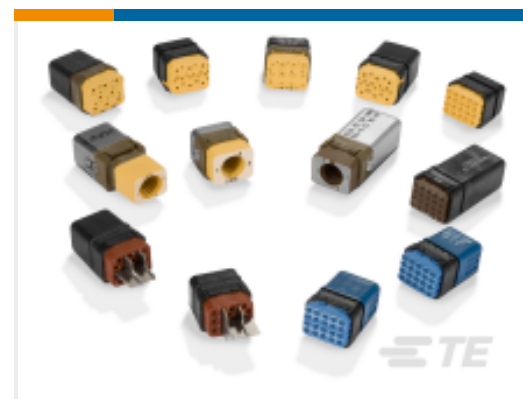
TE 产品编号 ZPF00000000015212 DMC-M 08-16 AA