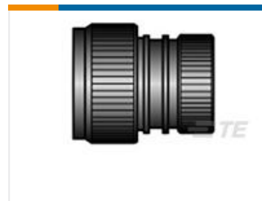
TE 产品编号 845305-000 HEX41-AC-00-21-A9-1