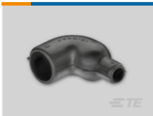
TE 产品编号 806823-000 球形热缩护套：有嘴，直角