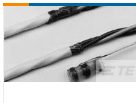
TE 产品编号 A59779-000 S200-3-01-100HN