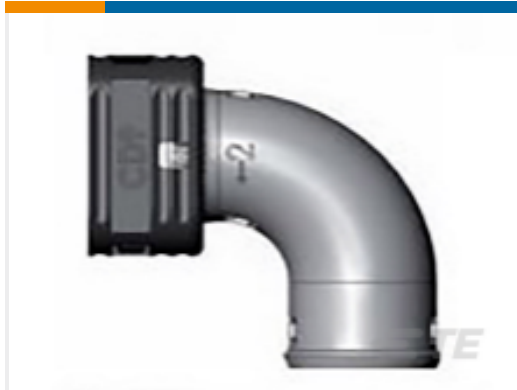
TE 产品编号ZPF000000000102764 787-8055-30M