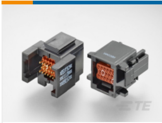
TE 产品编号ABC06N-22P IN-LINE PLUG