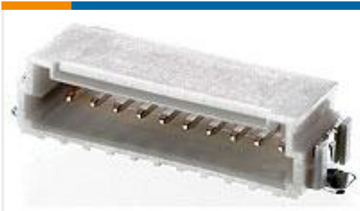
TE 产品编号 292228-2 1.5 MINI CT SGL H SMT W/O BOSS