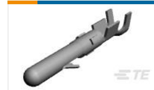
TE 产品编号 61116-6 CMNL PIN 24-18 AUNIPHZ