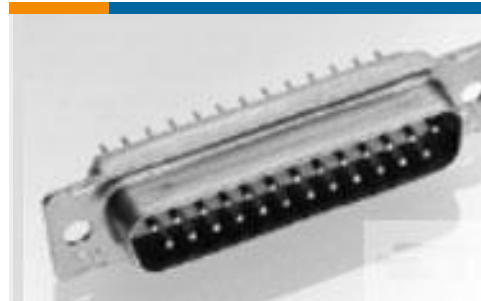
TE 产品编号 204506-1 RECEPT ASSY,62 POSN,AMPLIMITE