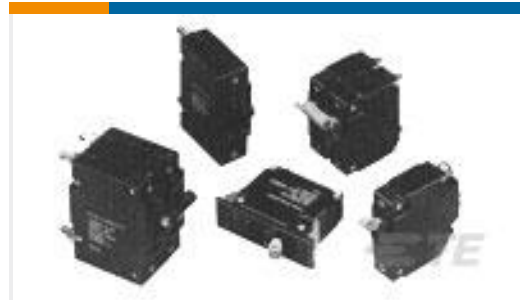
TE 产品编号1-1393254-6 W91-X1110-10=M6/M7/M9/W6/W7