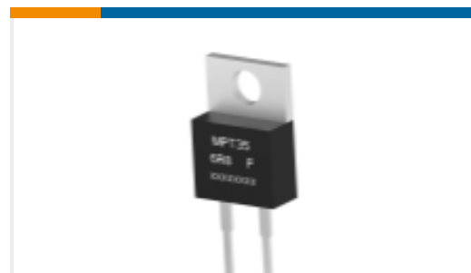
TE 产品编号1-2176430-4 MPT35 15R 5%