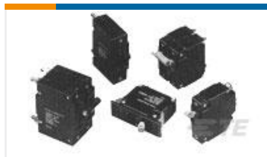
TE 产品编号 1-1393255-3 W93-X112-50=M6/M7/M9/W6/W7