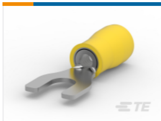
TE 产品编号 8-32589-2 TERMINAL,PIDG SPD 12-10 10