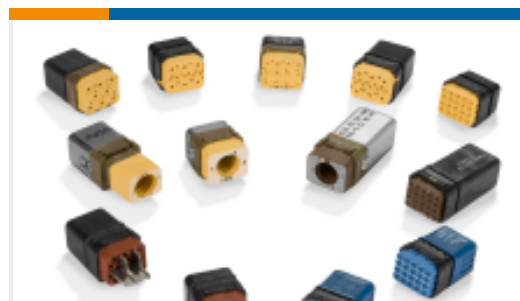
TE 产品编号ZPF00000000015188 DMC-M 04-12 BB