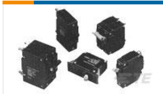
TE 产品编号2-1393254-3 W91-X112-15=M6/M7/M9/W6/W7