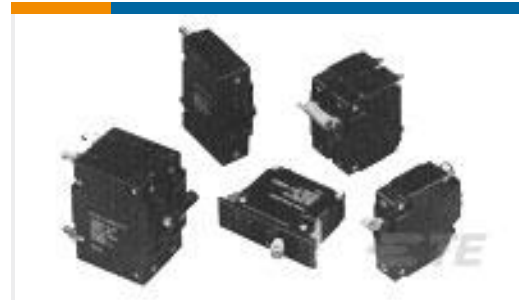
TE 产品编号1-1393255-2 W93-X112-5=M6/M7/M9/W6/W7