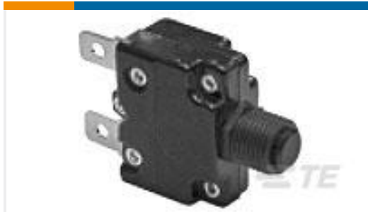
TE 产品编号1423675-3 W57-XB7A4A10-5=CKTBKR,THERM,PB