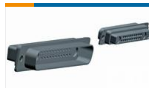
TE 产品编号 208742-1 PLUG ASSY, COAX MIX, AMPLIMITE