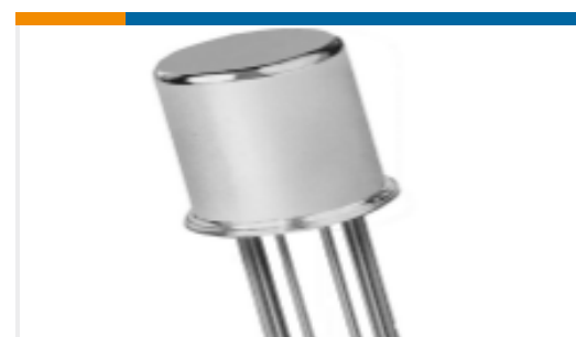
TE 产品编号 1-1617118-3 J1MACD-12XLS = M39016/23-034L