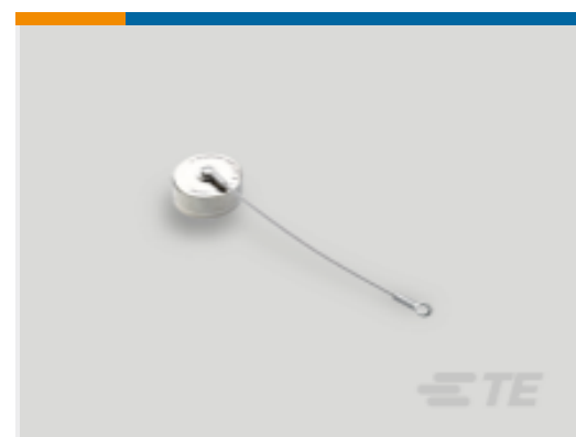
TE 产品编号 YDTS33T09RV0010000 CAP ASSEMBLY