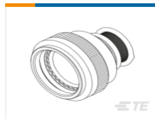
TE 产品编号 C92466-000 TX40AB00-2216H