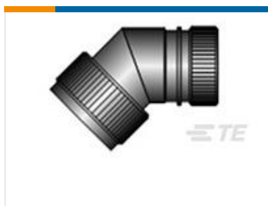
TE 产品编号CZ6862-000 HEX40-AC-45-25-A12-3