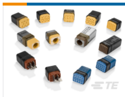
TE 产品编号ZPF00000000015141 DMC-M 01-08 AB