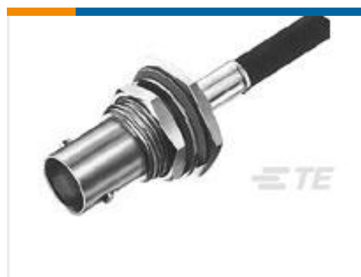
TE 产品编号225398-6 CONNECTOR, BNC DUAL CRIMP JACK