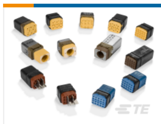
TE 产品编号ZPF000000000203708 DMC-M 99-10 PC