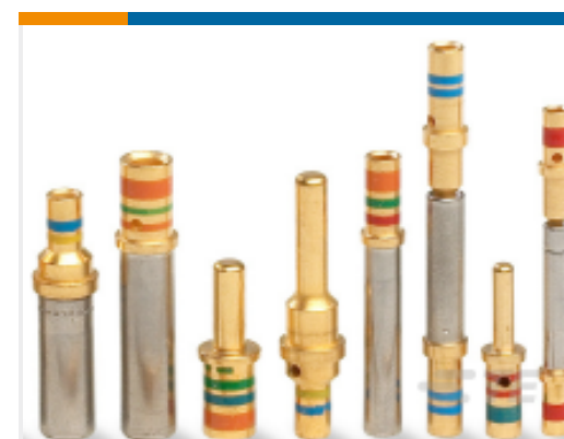
TE 产品编号106046-31 CONT SOC ASSY