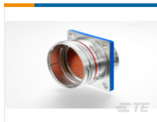
TE 产品编号DG1236R2045P23025 PLUG ASSY