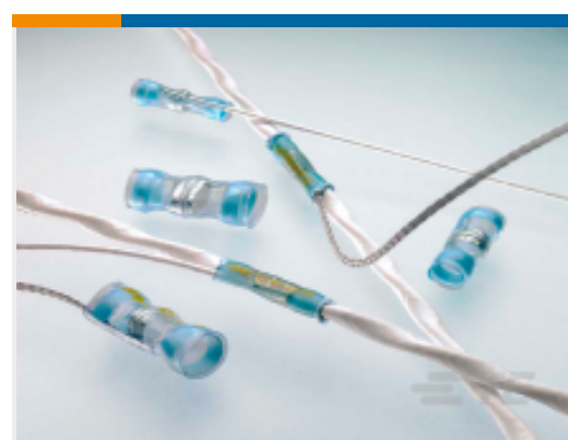
TE 产品编号CB0217-000 S200-5-W2-20-9