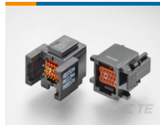
TE 产品编号ABC06G-20S-4048 IN-LINE PLUG