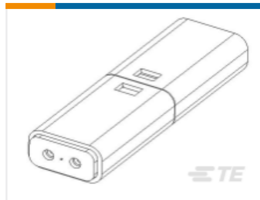
TE 产品编号65053-203 ELEC MODULE