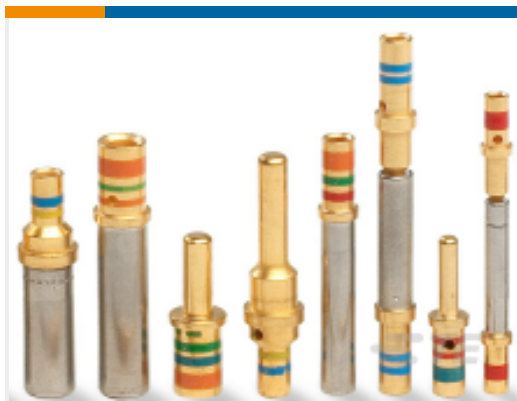
TE 产品编号12343-16-20 CONT SOC ASSY