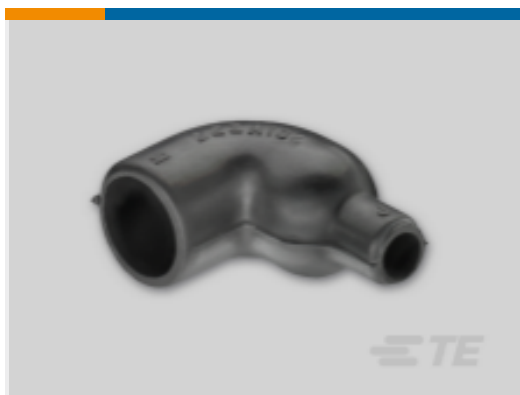
TE 产品编号 806823-000 球形热缩护套：有嘴，直角