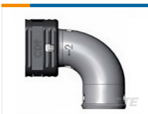
TE 产品编号ZPF000000000102764 787-8055-30M