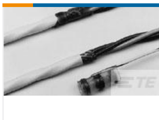
TE 产品编号 C88166-000 S200-1-W1-22-9