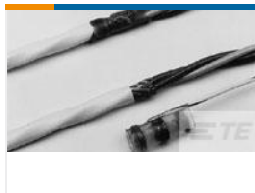
TE 产品编号C88166-000 S200-1-W1-22-9