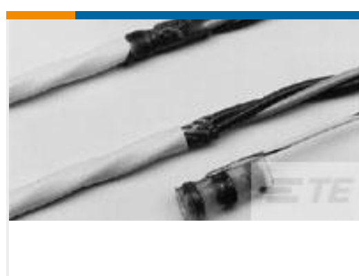
TE 产品编号 A74731-000 S200-2-W1-22-9