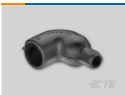
TE 产品编号 806823-000 球形热缩护套：有嘴，直角