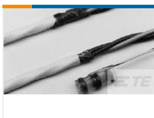
TE 产品编号 C88166-000 S200-1-W1-22-9