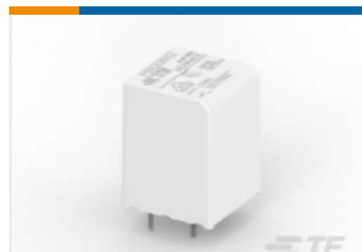
TE 产品编号 7-1415539-8 PB133012