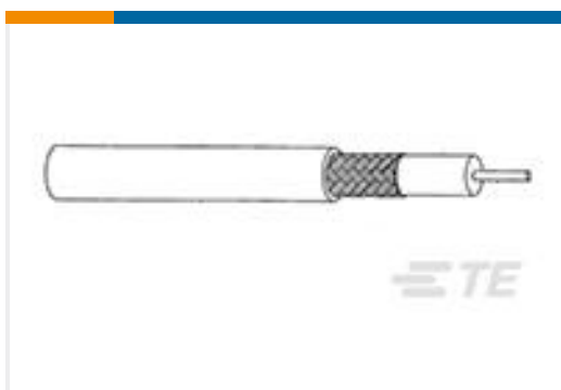
TE 产品编号 4407883001 5030A1318-9