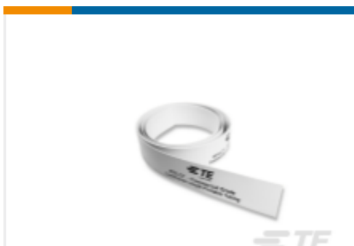
TE 产品编号 EL7587-000 RPS-CT-50M-12.7-OUT-9