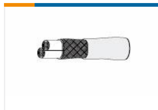
TE 产品编号 6127073002 55T9239-24-0/9-9