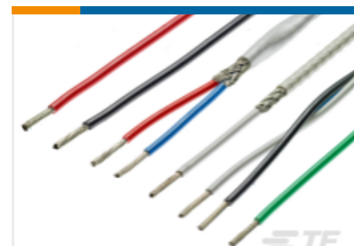
TE 产品编号 3824513002 44A4121-20-0/9-9