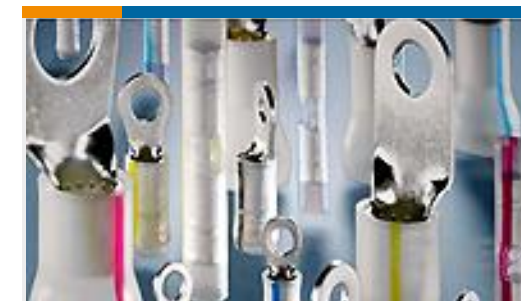
TE 产品编号53809-2 TERMINAL,PIDG PVF2 R 24-20 6