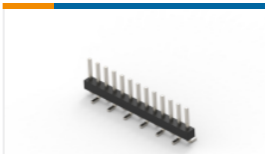
TE 产品编号6-146132-1 13 MODII HDR SR SFMNT B/A .100