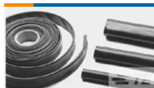
TE 产品编号CB5038-000 BSTS-13X4/NM