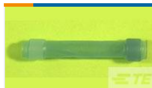
TE 产品编号 650080-000 D-436-45