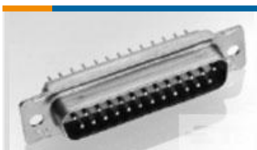
TE 产品编号 204512-2 RECEPT ASSY,SZ 1,AMPLIMITE