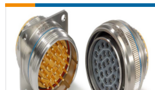
TE 产品编号 ZPF000000000037183 983-6SE 22-19 PN