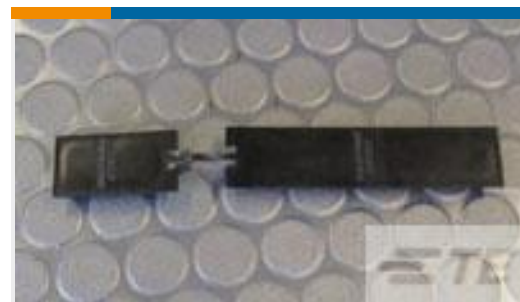
TE 产品编号 211600-2 DUST COVER,SZ 2,NIC 600