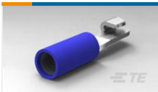
TE 产品编号 320566 KNIFE DISCONNECT,N PIDG 16-14