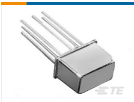
TE 产品编号1617147-5 JMGAP-26P = M39016/17-030P