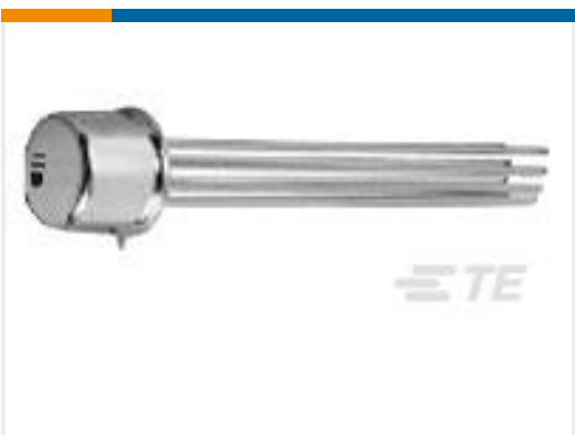
TE 产品编号1617119-5 J1MAW-18XP = M39016/7-021P