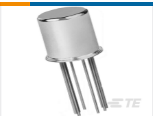
TE 产品编号1617164-7 JMACT-5XL = M28776/1-025L