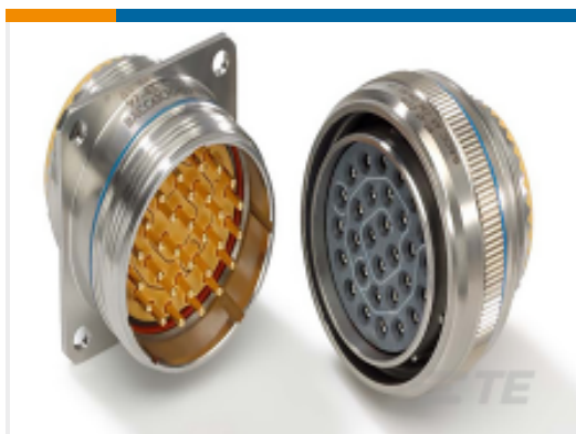
TE 产品编号ZPF000000000007174 983-ORS 08-98 PN