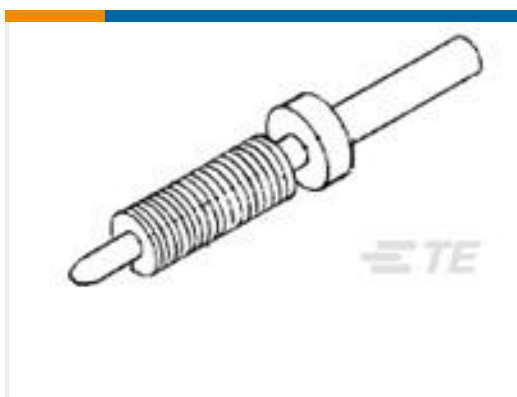
TE 产品编号 530754-1 BOX JACKSCREW ASSY-MALE