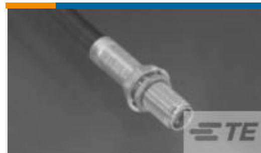
TE 产品编号 1051994-1 2034 8026 92