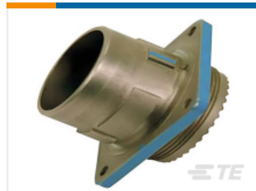
TE 产品编号 YDIV40E25-19PBC009 RECP ASSY