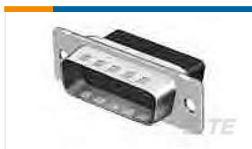
TE 产品编号205204-4 CRIMP SNAP PLUG ASSY,SIZE 1