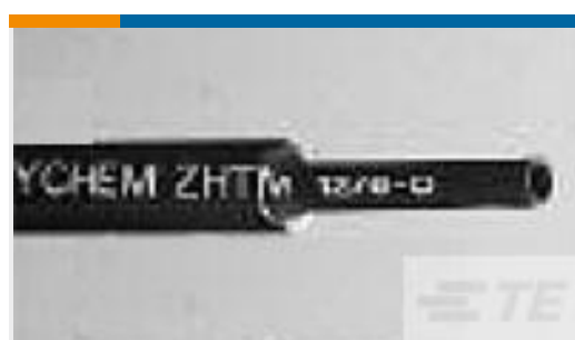
TE 产品编号2023374003 ZHTM-5/2.5-0-SP