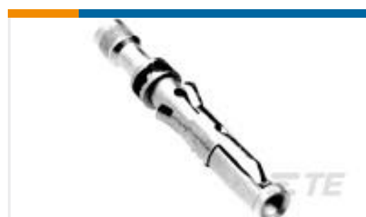
TE 产品编号201328-1 CONTACT SOCKET ASSY.