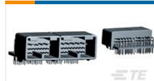
TE 产品编号1318750-2 025/090 CAP ASSY 50P