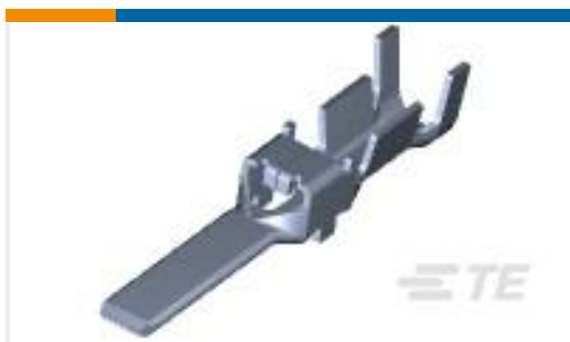
TE 产品编号1-1747501-2 DYNAMIC D4200 TAB CONT M/LP LONG