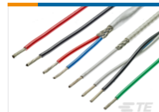
TE 产品编号A101463001 99M0131-24-2/5/9