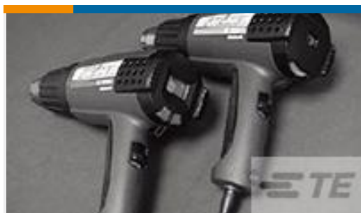
TE 产品编号 CJ2087-000 HL2010E-KIT-120V