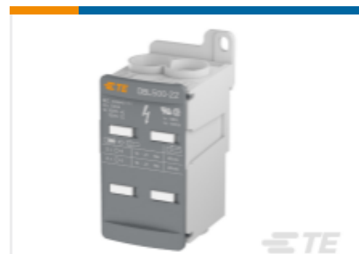
TE 产品编号1SNL850001R0000 DBL500-22