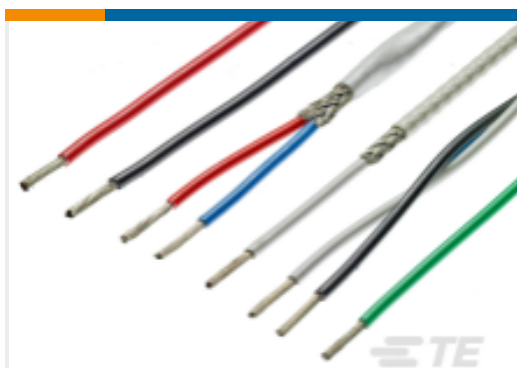
TE 产品编号4714093001 99M0121-20-2/9