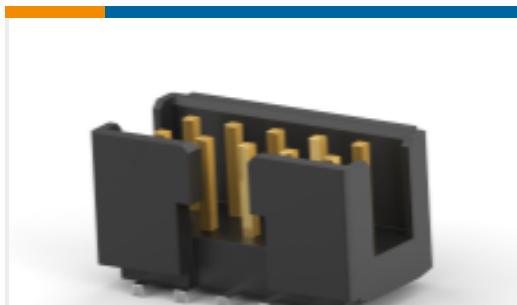
TE 产品编号1-2373376-0 10P,2MM,SHRDR HDR,DRVT,SMD,0.1 AU,TB