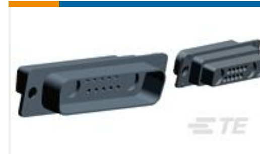
TE 产品编号208810-2 PLUG ASSY,COAX MIX,AMPLIMITE