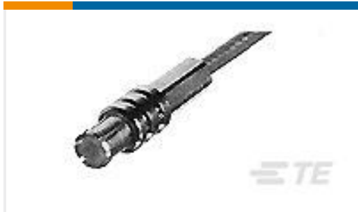
TE 产品编号1060875-2 MCX CABLE PLUG, CRIMP ATTACH