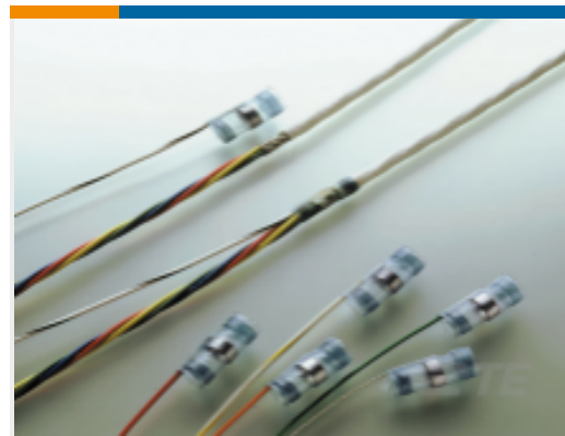
TE 产品编号459933N002 S02-07-R-5CS816