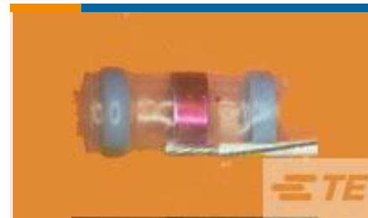
TE 产品编号932425N002 S02-08-R-6CS816