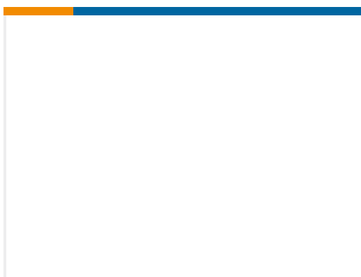
TE 产品编号111798-ZZ CONT SOC ASSY