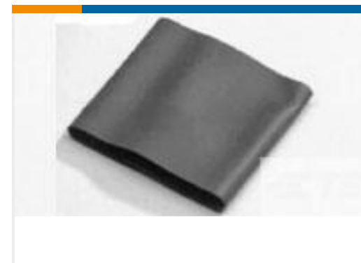
TE 产品编号046571J001 V2-18.0-0-FSP-SM