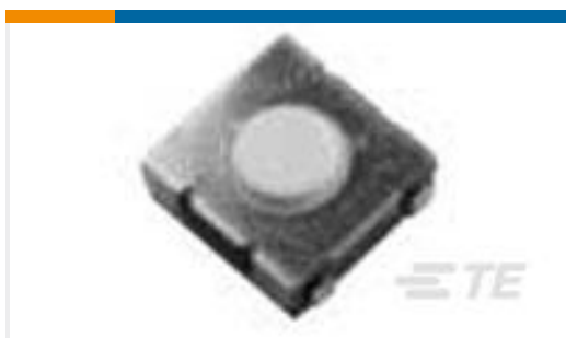
TE 产品编号1571626-2 TACT,SMT,GULL WING,50GF,T&R