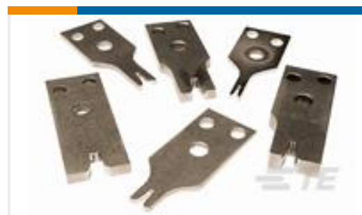
TE 产品编号1-937188-0 WIRE CRIMPER