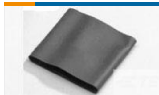
TE 产品编号985923J001 V2-6.0-0-SP-SM