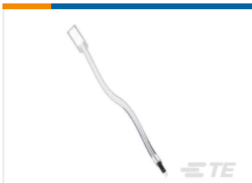
TE 产品编号11031269-00 FDT1-028K W/MALE CONN W/O ADH