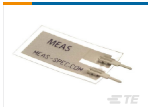
TE 产品编号11032265-00 DT1-052K N/TH N/HOLE