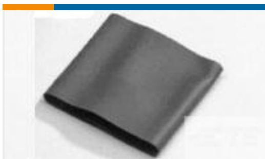
TE 产品编号115607J001 V2-12.0-0-FSP-SM