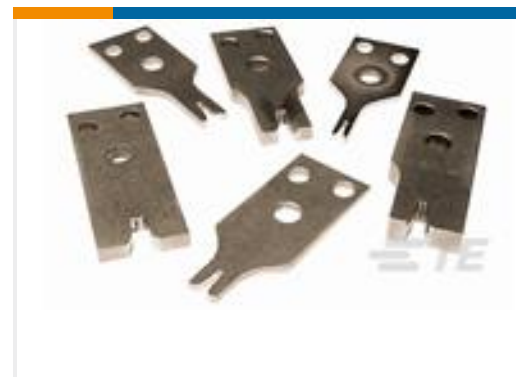
TE 产品编号1-456405-3 CRIMPER WIRE .080 F