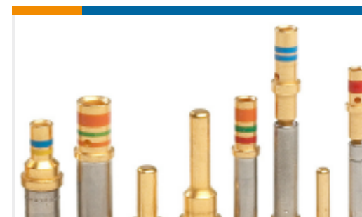
TE 产品编号 1662-213-2031 CONT SOC ASSY