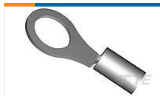
TE 产品编号 53041 TERMINAL,T-N R 8 8