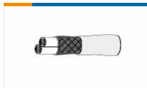
TE 产品编号 169161-000 55PC1121-20-2/6-9CS2502