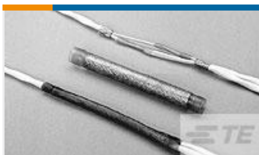
TE 产品编号 544155-000 D-150-9133