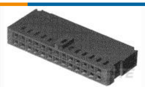
TE 产品编号 102387-8 34 MODIV HSG COMP DR .100 POL