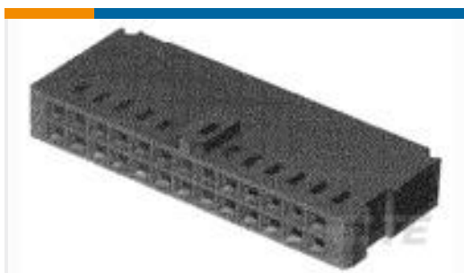
TE 产品编号 102387-6 26 MODIV HSG COMP DR .100 POL