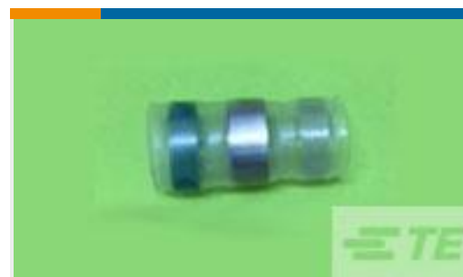
TE 产品编号 564761-000 D-142-52CS918