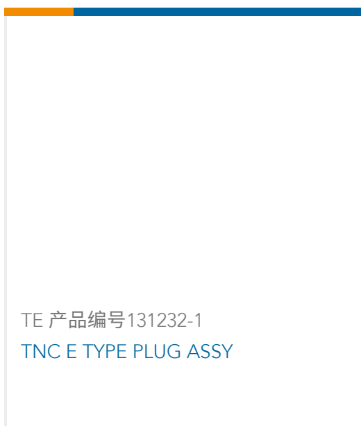
TE 产品编号131232-1 TNC E TYPE PLUG ASSY