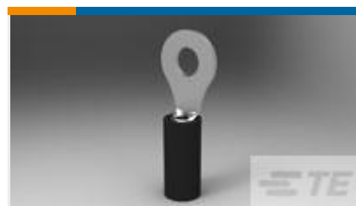
TE 产品编号151439 PIDG 22 RING #6