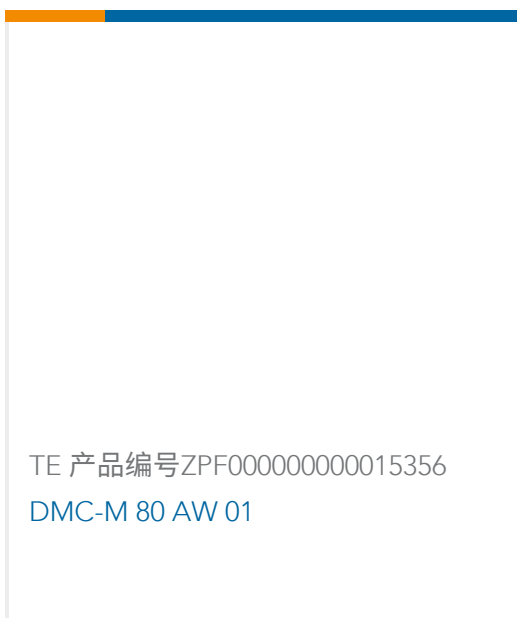
TE 产品编号ZPF000000000015356 DMC-M 80 AW 01