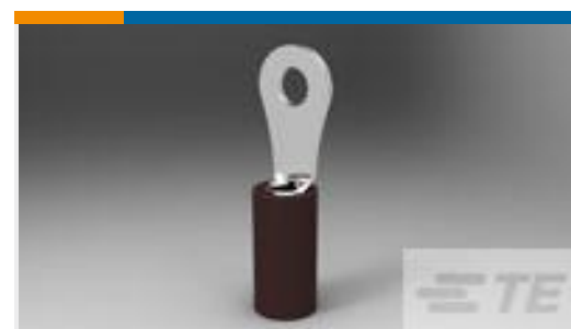
TE 产品编号1577616-1 TERMINAL, PEEK PIDG STRATO, 24-22AWG