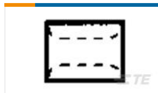
TE 产品编号323754 SPLICE,SOLIS PARA HR 12-10