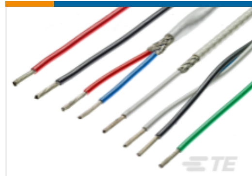
TE 产品编号318661-000 CTC-0041-20