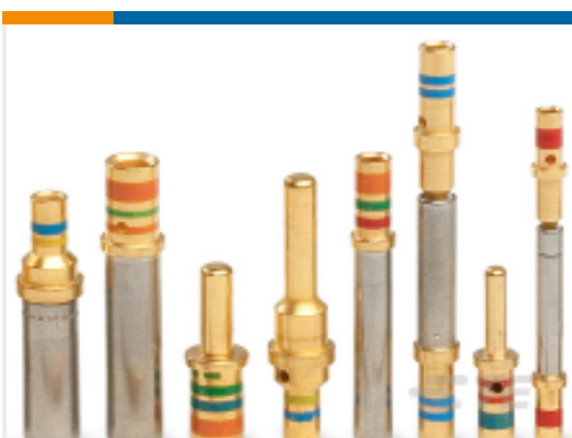
TE 产品编号 12333-22 CONT T.22 FEMELLE 1500 (SEE 182-0447-22)