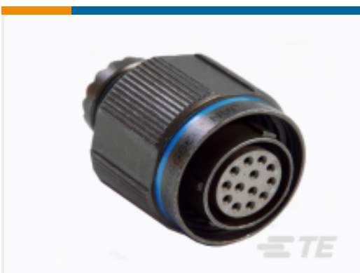
TE 产品编号 YDTS26W23-35SNV001 PLUG ASSY