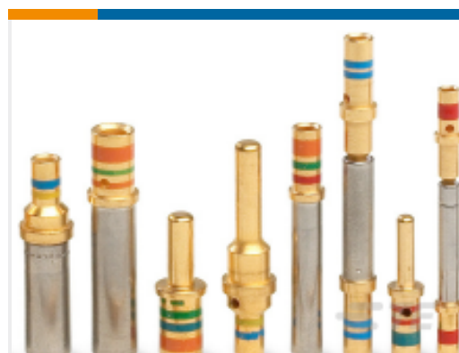
TE 产品编号 12333-20 CONT SOC ASSY