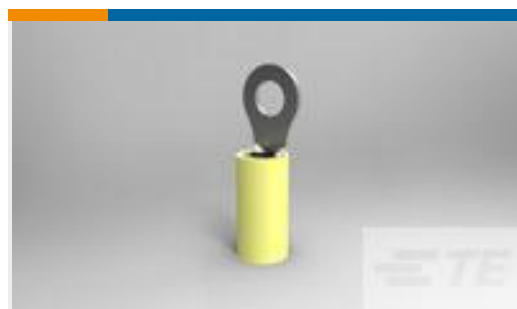
TE 产品编号 2-36161-4 TERMINAL,PIDG R IR 10 10