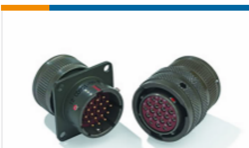
TE 产品编号 ZPF00000000148271 951-06 RC 14-18 SW 50