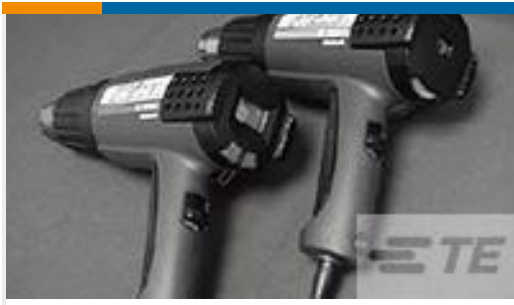
TE 产品编号 CJ2087-000 HL2010E-KIT-120V