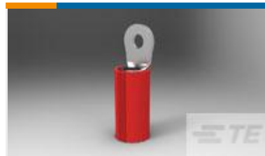
TE 产品编号 131644-1 TERM, PIDG, 20 AWG, IR, #4 STUD