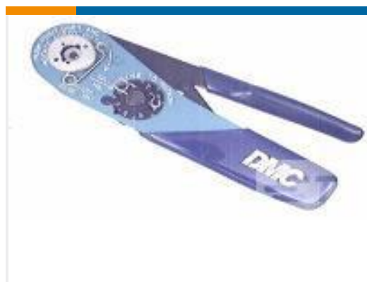
TE 产品编号 601966-1 CRIMPING TOOL M22520/2-01