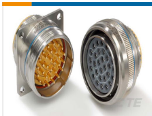
TE 产品编号ZPF000000000007174 983-ORS 08-98 PN