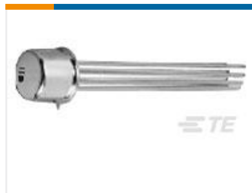
TE 产品编号1617119-5 J1MAW-18XP = M39016/7-021P