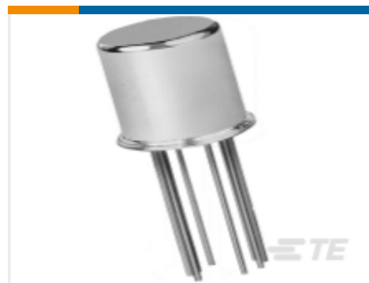
TE 产品编号1617164-7 JMACT-5XL = M28776/1-025L