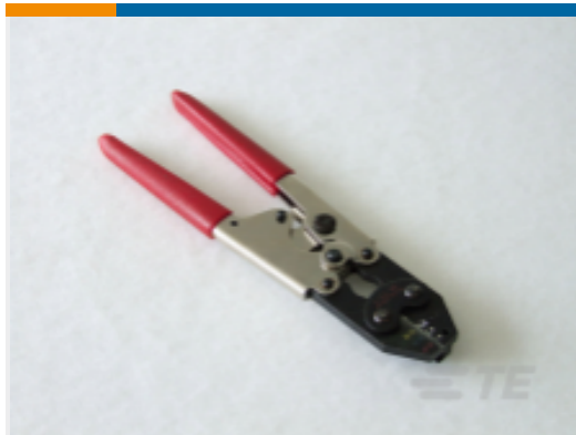
TE 产品编号 992008-000 AD-1377-CRIMP-TOOL-3-CVTY