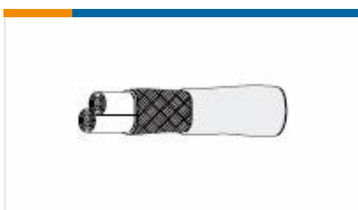
TE 产品编号575673-000 55A1813-20-9-9CS2275