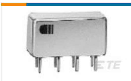
TE 产品编号1617038-6 HMB1130K01M = M39016/22-004M