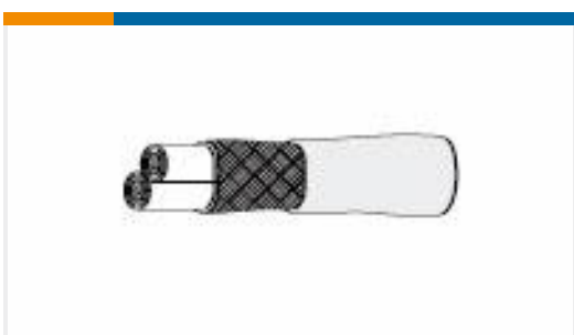
TE 产品编号944249-000 55A1833-22-MST3-9CS2275