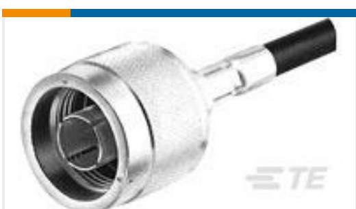
TE 产品编号415264-1 N SEIES PLUG