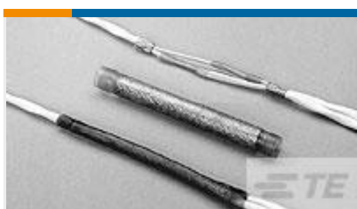
TE 产品编号A11769-000 D-150-0321