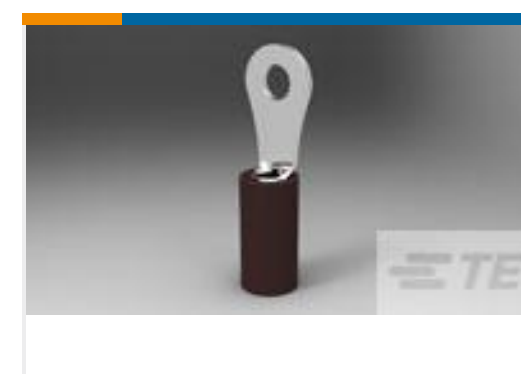
TE 产品编号 1577620-1 TERMINAL RT PIDG PEEK STRATO 24-22 AWG