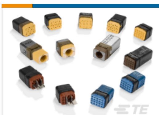
TE 产品编号 ZPF000000000015204 DMC-M 04-12 PNE