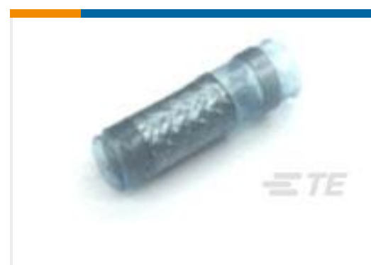
TE 产品编号 046205-000 B-070-12-11-01