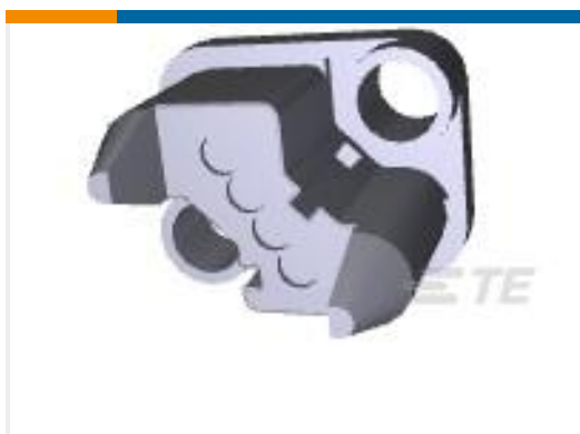
TE 产品编号 212608-1 PLUG HSG,4 POSN,METRIMATE