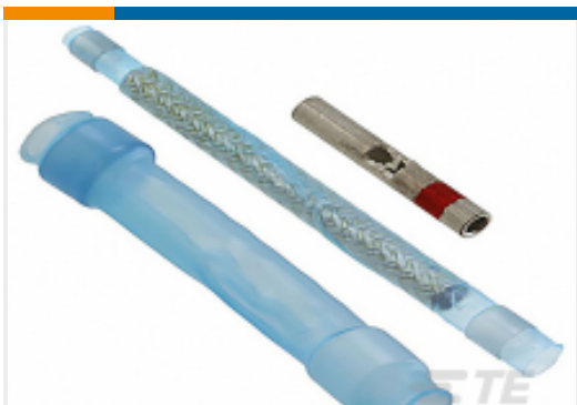
TE 产品编号307416-000 D-150-1010