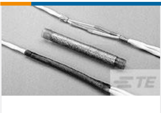
TE 产品编号610147-000 D-150-1013