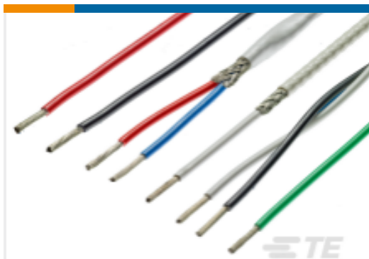
TE 产品编号2653473001 100G0111-1.50-8